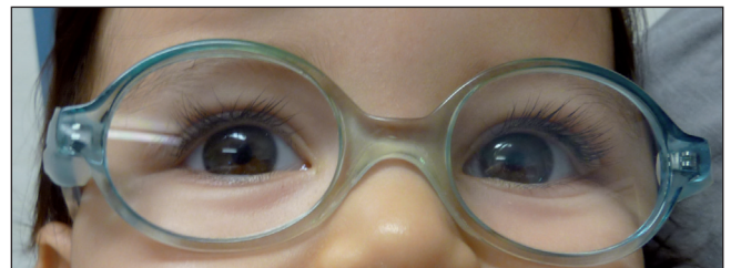
Figure 3. Monture pédiatrique adaptée, pont bas, en plastique, recouvrant les sourcils.

Le port de la correction optique totale ne freine pas l'emmétropisation, le phénomène d'emmétropisation restant à ce jour encore largement débattu.